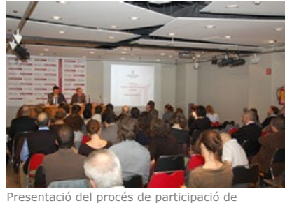
Presentació del procés de participació de l'EcodisCAT. 25 d'octubre de 2011. Palau Robert

La Direcció General de Qualitat Ambiental del Departament de Territori i Sostenibilitat té entre les seves competències difondre l'ecodisseny, eina de gran utilitat per a les empreses, per tal d'incorporar aspectes ambientals en els seus productes i serveis.