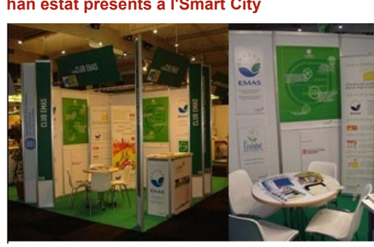
Estand del Club EMAS i del Departament de Territori i Sostenibilitat.

Del 29 de novembre al 2 de desembre d'enguany, el Club Emass, amb el suport del Departament de Territori i Sostenibilitat de la Generalitat de Catalunya, va participar en la primera edició de l'SmartCity Expo & World Congress a la Fira de Barcelona, amb l'objectiu de difondre en aquest espai les eines de qualificació ambiental: el sistema de gestió ambiental EMAS, l'Etiqueta ecològica de la Unió Europea (Ecolabel) i el Distintiu de garantia de qualitat ambiental de la Generalitat de Catalunya.