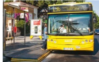
Plataforma Bus de ZICLA, El almacén del producto reciclado, SL.

Enguany s'ha celebrat la sisena edició del Premi Disseny pel Reciclatge 2011, convocat cada dos anys per la Agència de Residus de Catalunya. Aquest Premi, creat l'any 2001, és una de les accions que realitza l'Agència de Residus de Catalunya per tal de promoure el disseny per al reciclatge, estratègia d'ecodisseny que minimitza els impactes ambientals a l'hora de dissenyar els productes, mitjançant la incorporació de materials reciclats i la facilitació de la reutilització i reciclabilitat dels productes. El Premi s'ha estructurat en 4 categories: productes, projectes, estratègies i materials. En l'edició d'enguany s'hi han presentat 188 candidatures.