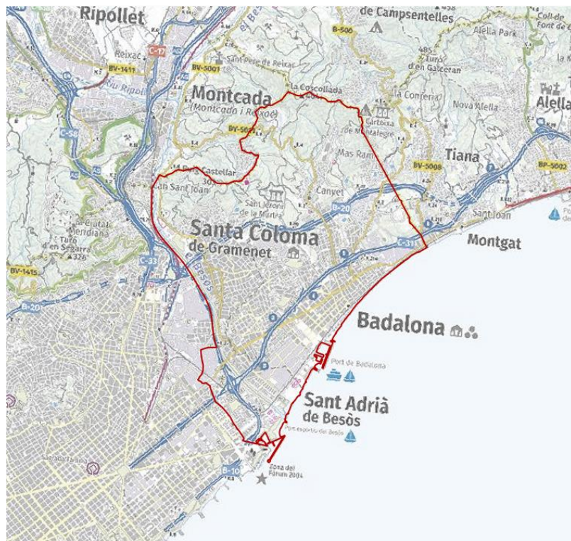
Figura 2: Límites de la aglomeración del Barcelonès, mapa de localización