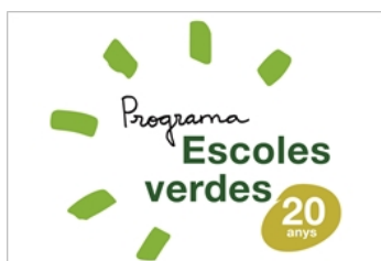
Programa d'escoles verdes