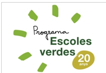
Programa d'escoles verdes