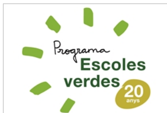
Programa d'escoles verdes