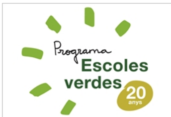
Programa d'escoles verdes