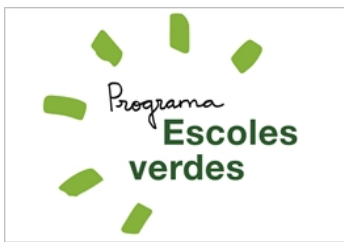
Programa d'escoles verdes