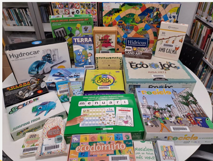
Jocs i kits