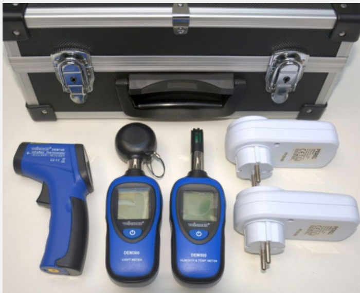
Aparells de mesura