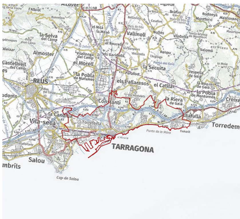
Figura 2: Límits de l'aglomeració del Tarragonès, mapa de localització